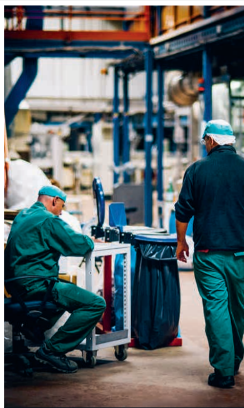
15 heures Le coopérateur engagé connaît chaque recoin de l'usine, qui s'étale sur 12 000 m².