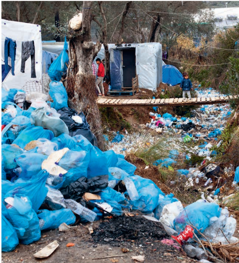
Moria, île grecque de Lesbos. Près de 14 000 demandeurs d'asile s'entassent dans une zone prévue pour 3 000 personnes. Le plus grand camp de réfugiés d'Europe se résume à un cloaque!

N ous avons demandé au préfet la mise en place en urgence, par l'intermédiaire de la sécurité civile, à Grande-Synthe [Nord, ndlr] comme à Calais [Pas-de-Calais], de plusieurs camps de 50 personnes. Cela permettrait, dans les vingt-quatre heures, et dans le respect des consignes [de confinement], d'éviter la promiscuité excessive sans compliquer la distribution des repas. » Le 21 mars, Jean-Claude Lenoir, président de l'association d'aide aux migrants Salam, désespère d'obtenir des conditions d'accueil dignes pour les centaines d'exilés (Syriens, Irakiens, Afghans...) présents à la frontière franco-britannique. Quelques jours plus tôt, 25 associations ont écrit au préfet des Hauts-de-France pour réclamer des « lieux d'hébergement », des « sites de distribution alimentaire » et des « points d'accès à l'eau et au savon ». Déjà extrêmement précaires, les conditions de survie des migrants se sont fortement durcies partout en Europe depuis le début de la pandémie de Covid-19. Et la fermeture des frontières extérieures de l'espace Schengen a assombri un peu plus l'avenir de ceux qui cherchent à rejoindre l'Europe.