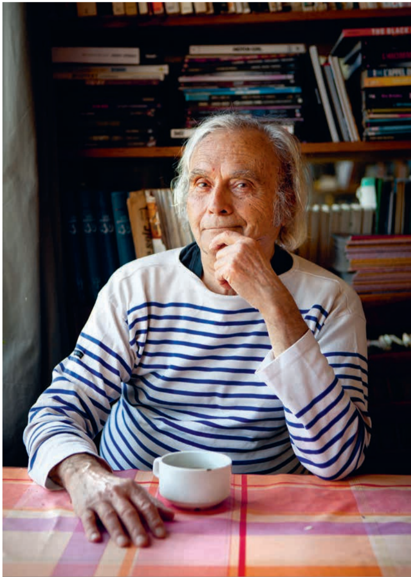
« Ce ne sont pas les plus forts qui résistent, ce sont les plus organisés. [...] La solidarité et l'entraide sont essentielles, on commence à s'en rendre compte. »

Orwell avait compris que pour tenir les gens sous sa coupe, il fallait inventer un danger ailleurs, une guerre mystérieuse, afin que les gens marchent comme un seul homme. Le personnage principal essaie de se révolter, puis il est peu à peu pris dans l'engrenage. À la fin de 1984 , le héros,