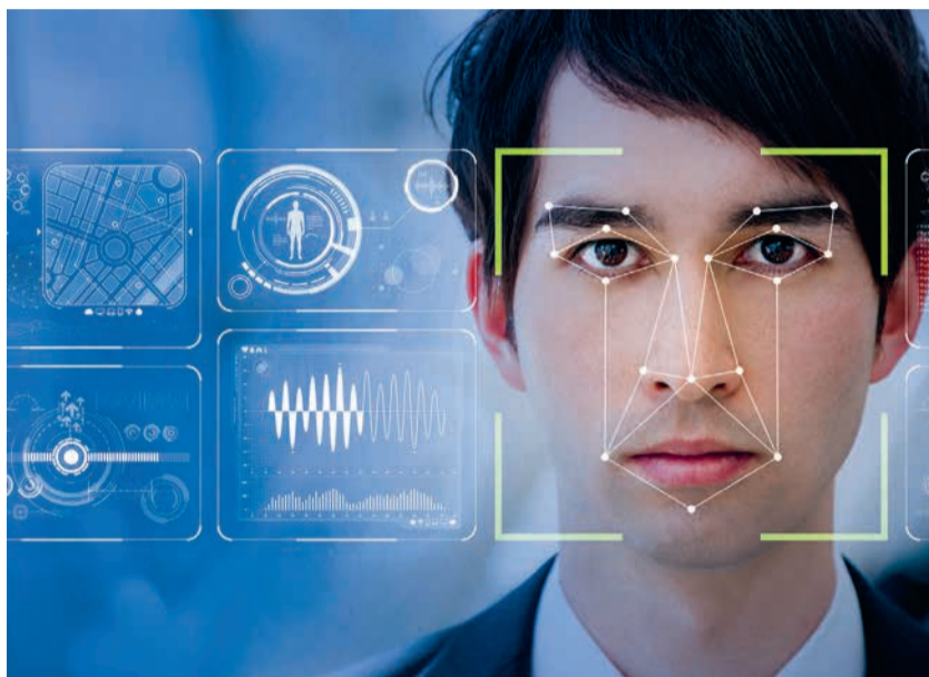
La reconnaissance faciale soulève des questions inédites touchant à nos choix de société. Un débat démocratique sur ce sujet, et l'utilisation des nouvelles technologies, doit voir le jour.

C haque jour, nous sommes toujours plus nombreux à l'utiliser pour déverrouiller nos téléphones ou nos ordinateurs. Depuis les attentats de 2015, elle facilite aussi le contrôle aux frontières ou réduit les temps d'attente dans les aéroports. Ses usages semblent illimités dans le domaine commercial ou bancaire et les essais à titre expérimental se multiplient. Parfois au mépris de la réglementation. C'est, là, le hic pour les associations, les syndicats ou la Commission nationale de l'informatique et des libertés (Cnil). Leur crainte : que le déploiement de la reconnaissance faciale débouche sur une surveillance de masse, au mépris des libertés individuelles et des droits fondamentaux. Récemment, une décision de justice est venue mettre en lumière la manière dont certaines villes mènent des expérimentations sans véritable débat public, ni contrôle. Désireuses d'installer des portails biométriques à l'entrée de deux lycées, Marseille