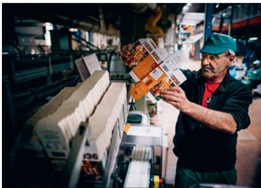
Chaque boîte de thé à la pomme-cannelle doit peser exactement 37,5 grammes.