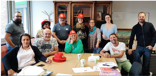
Avec la CGT, défendre l'ensemble des salarié.es

La Fédération THCB organisait fin août la deuxième session du stage de l'Ugict (Union générale des ingénieurs cadres et techniciens) pour « Gagner dans le 2ème et 3ème collèges ».