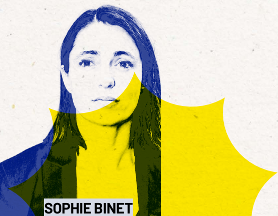
SOPHIE BINET secrétaire générale de la CGT

Grâce à notre mobilisation historique, le sujet des retraites est toujours au centre de l'actualité. Le gouvernement a été contraint d'ouvrir des concertations et les parlementaires doivent ensuite voter. Patronat et gouvernement font tout pour empêcher l'abrogation de la réforme mais notre mobilisation va faire la différence. Une large majorité de Français-es comme de député-es sont toujours opposé-es à la réforme. Financer le retour à 62 ans et même à 60 ans est à notre portée, c'est une question de répartition des richesses !